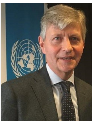
Jean-Pierre LACROIX, Secrétaire général adjoint aux opérations de maintien de la paix.

Le département dirige les opérations de maintien de la paix des Nations Unies et est en lien avec le Conseil de Sécurité, les troupes, les contributeurs financiers, ainsi que les parties impliquées dans les conflits dans le cadre de la mise en œuvre des mandats du Conseil de Sécurité.