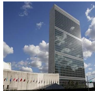
Le siège de l'ONU à New York

UNLOPS représente les trois départements du Secrétariat des Nations Unies à New York chargés de superviser la paix et sécurité au niveau international: le département des opérations de maintien de la paix , le département des affaires politiques et le département de l'appui aux missions . UNLOPS contribue au développement d'un dialogue institutionnel solide et à une meilleure coordination en matière de politiques et d'opérations dans les domaines de la paix et de la sécurité.